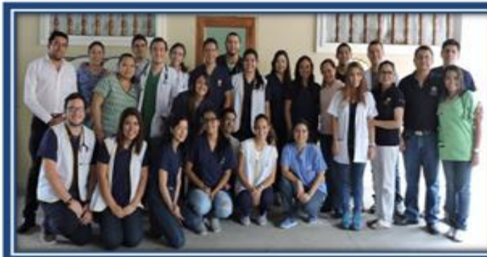
Equipo de la brigada en Ciudad Delgado