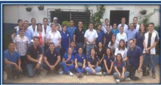
Equipo de la brigada en Ahuachapán

Con el propósito de integrar las funciones sustantivas, se realizó la brigada médica integral, los días 20 de mayo en Ahuachapán y 4 de junio en Ciudad Delgado, con la participación de la Brigada Amiga UEES y alumnos de 4° y 5° año de la carrera de Nutrición, se brindó atención médica, toma de citología, antropometría, consulta nutricional y densitometría.