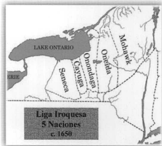
Figura 5. Liga Iroquesa

masen una alianza en vez de seguir empeñados en luchar continuamente entre sí. Sólo los onondagas siguieron negándose a pactar (Figura 5).