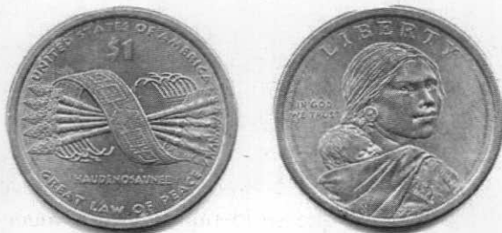
Figura 1. Un lado de la moneda inscribe la denominación del modelo sociopolítico: Haudenosaunee

La más reciente acuñación oficial del valor unitario del dólar exhibe en su bruñida iconografía los principios más caros del original proyecto concertado por la «Liga Iroquesa».