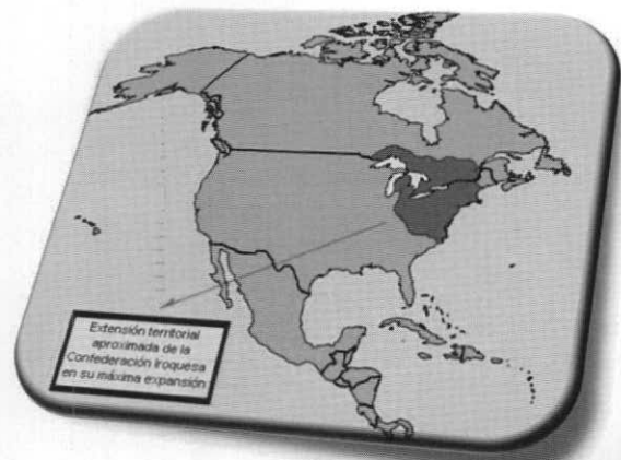
Figura 4. Extensión territorial aproximada de la confederación Iroquesa.

La «Liga Iroquesa» (Figura 4) llegó a el mayor sistema de gobierno indígena al norte de los dominios de la civilización azteca (Weatherford, 1988) en los dos siglos anteriores a la llegada de Colón; y sin duda, el mayor en los dos siglos siguientes (Mann, 2006). Pero, antes de alcanzar tal proeza civilizatoria, las naciones Haudenosaunee vivieron durante un prolongado período bajo una vorágine de enfrentamientos y venganzas entre ellas.