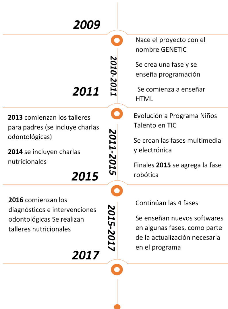
Figura 1. Línea del tiempo de la evolución del programa en el periodo 2009 al 2017.

Nota: Elaboración propia con la información obtenida de las entrevistas con ex decanos y ex coordinadores de carrera y revisión documental.