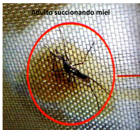
Figura 1. Macho de Toxorhynchites sp alimentándose de miel

Para una caracterización simple de los estadios larvarios 3 y 4, se observó y midió su tamaño; para lo cual, se colocaron en Cajas Petri sobre papel milimetrado, luego se depositaron las larvas y con una lupa, se procedió a contar el número de mm comprendidos en largo y ancho. Se midió así: la longitud que corresponde desde la parte posterior de la cabeza hasta la parte anterior de la cola (largo); para medir el ancho se midió la cabeza, aprovechando la rigidez de su exoesqueleto duro.