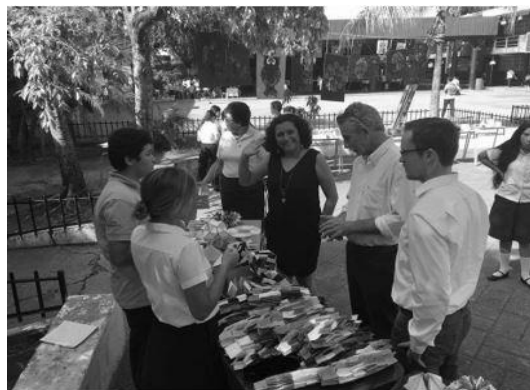
Figura n.º 3. Feria STEM organizada en junio 2017 por el Centro Escolar Concha Viuda de Escalón.

El proyecto ha tenido un efecto multiplicador. En junio del año 2017, los docentes del C.E. Concha Viuda de Escalón organizaron la primera feria STEM. Los estudiantes realizaron proyectos en las áreas de ciencias, matemáticas y artes estéticas (Figura n.º 3).